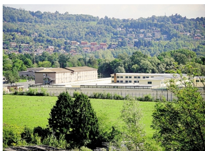
Il carcere comasco del Bassone ARCHIVIO

Ma a questi due "guai" storici della nostra casa circondariale, che quest'anno è purtroppo entrata anche nell'elenco delle carceri con almeno un suicidio (quello avvenuto nel mese di aprile di quest'anno, con vittima un trentaduenne) e molti altri sventati proprio dalla prontezza degli agenti della peniten-