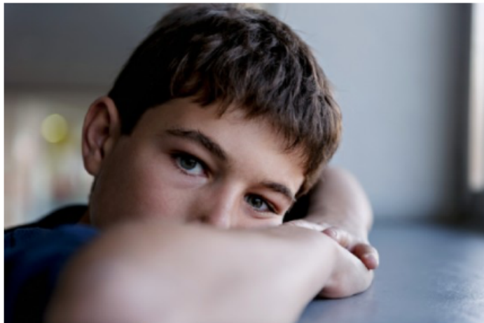
Autismo e comportamenti stereotipati